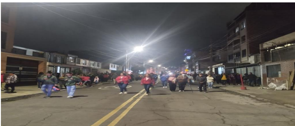
Procesión del viernes santo por los alrededores de la iglesia del 20 de julio