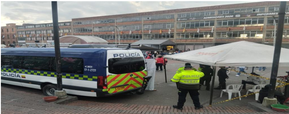
Operativo 20 de Julio PMU (Puesto de Mando Unificado) con Entidades del Distrito.

Se registró un total acumulado de 53.700 personas, con pico máximo a las 12:00 h (16.000 asistentes).